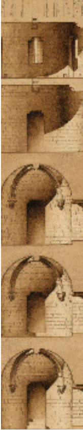
Nicq-Doutreligne, Cambrai. Château de Selles, coupe verticale d'une tour, restitution - détail, lavis sur papier